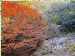
琴弾の滝 左手の階段を上ってご覧ください。