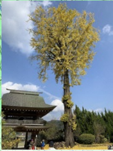
正福寺の大イチョウ 秋はとともきれいです！