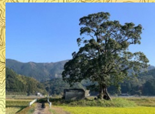
大原貴船神社大クス 木の下に小さな鳥居があります。